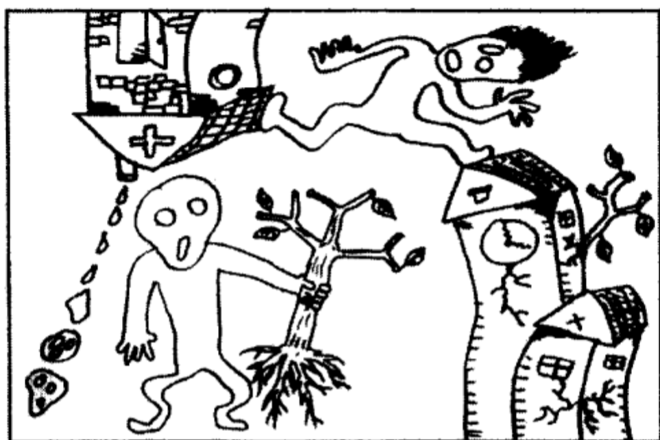
“房树人测验”的某些特定意义

漏,如不画门、窗、树叶,人物缺乏耳朵、鼻子等主要器官,还有的在表达手法上,表现出矛盾,古怪的形象,图形结构不完整,描绘时间过短而草率等。