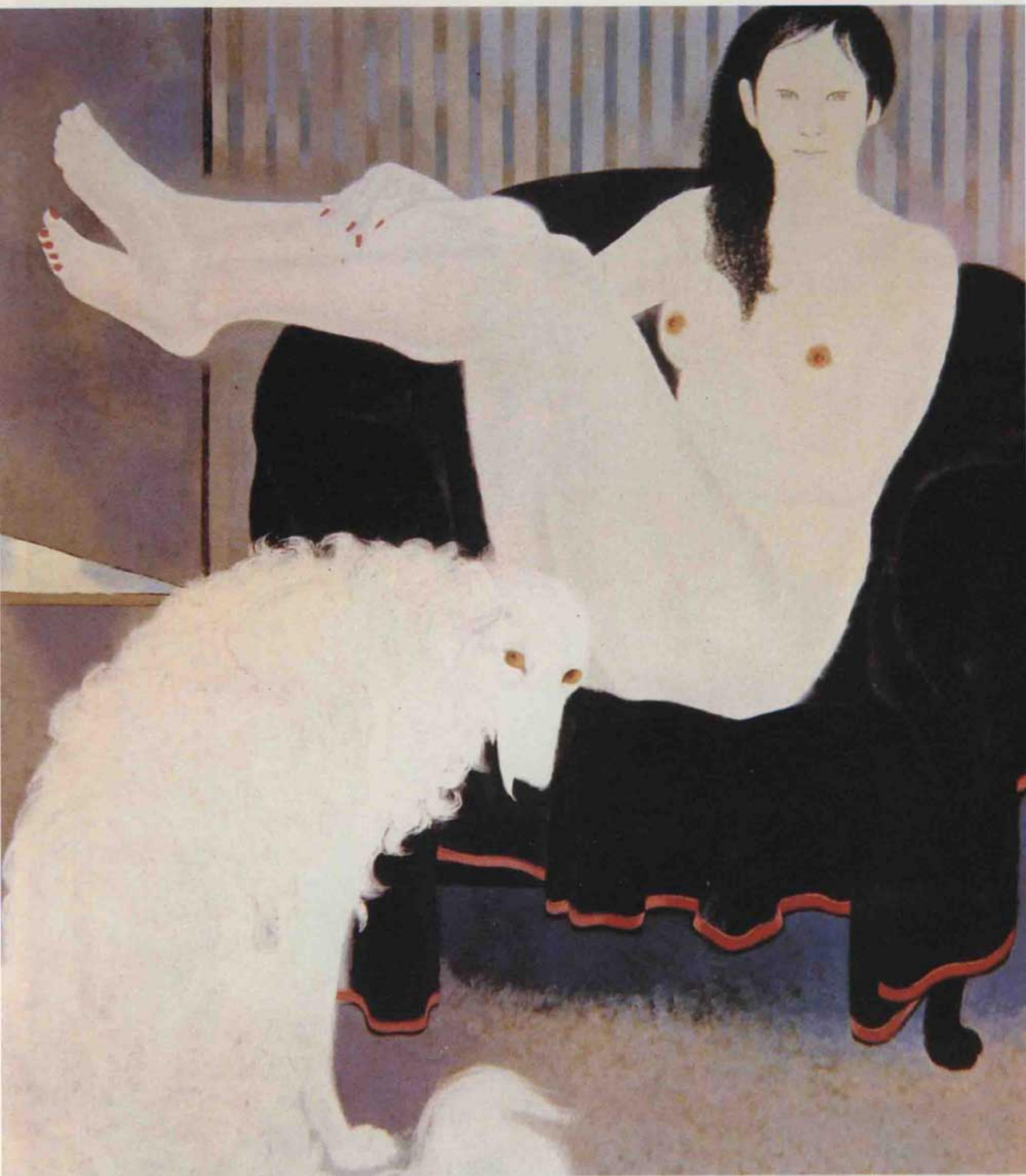
3. 室内 (日本畫) 室井東志生