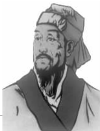
零贰叁 137 《天论》