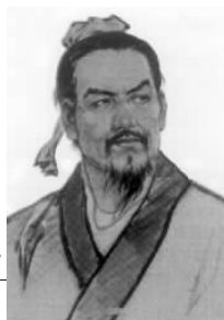
零贰伍 153 《五蠹》