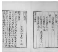
零贰贰 126 《劝学》