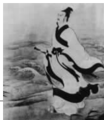
零贰肆 148 《卜居》