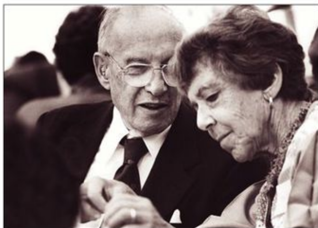
彼得·德鲁克和妻子多丽丝·德鲁克