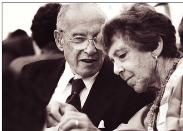
彼得·德鲁克和妻子多丽丝·德鲁克