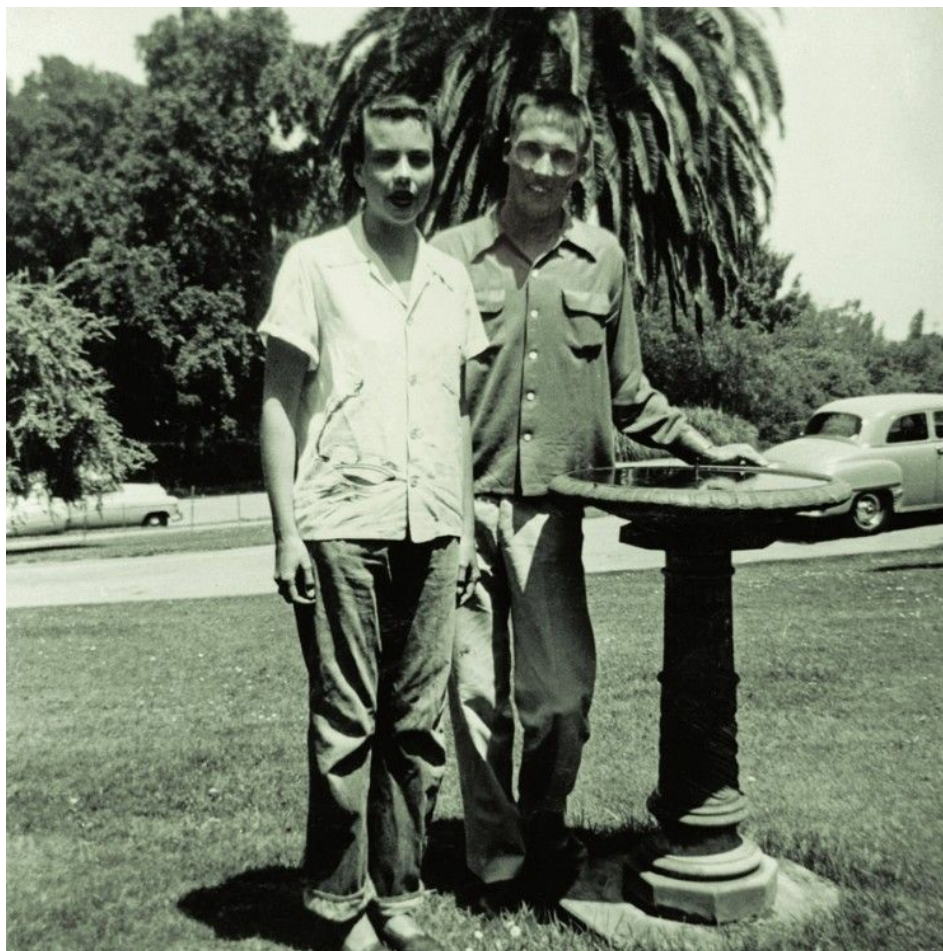
桑德拉与同学威廉·伦奎斯特约会，他后来成为美国最高法院首席大法官。1952年春，伦奎斯特向桑德拉求婚，但是她当时已经与约翰·奥康纳坠入爱河。